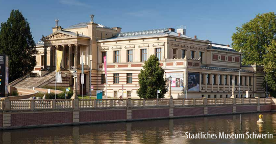
Staatliches Museum Schwerin